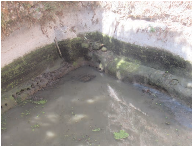
רשת מברזל שתחתיה נמצא ברז שמחזיק את מי הבריכה כאשר היא מלאה

כאשר מה שמחזיק את המים הוא כלי שיש לו בית קיבול, דוגמת ברז סגור, אז הדבר חמור שבעתיים. בית הקיבול נקרא בלשון המשנה 'אביק שבמרחץ' (מקוואות ו, י), כל המים נחשבים שאובים מפני שהם 'גרורים על גביו' (לשון הר"ש שם). בפסול זה אין מחלוקת 9 . נתקלתי במציאות זו בכמה מעיינות מפורסמים.