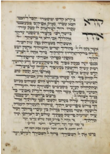
Palatina Library, Parma, Cod. 1265, f. 79v

אֹדֶךָ בְּיוֹשֵׁר לִבִּי בְלִמְדֵי מִשְׁפָּטֵי צְדָקָה אֲהַלְלֶךָ אֲנִי וְלֹא זָר בְּחֻשְׁקֶךָ אֲשַׁמְחֶה בְּשִׂמְחַת נֶפֶת צִוְיָ חֲפִיךָ אֲשֶׁר נָתַתָּ לִי יִי פְקוּדֵיךָ יִשְׂרָאֵל וְחֻשׁוֹקֶיךָ 5 אֶהְגֶּה יוֹמָם וְלַיְלָה בְּחֻרוֹץ יִרְקַרְקֶיךָ בְּרוּךְ אַתָּה יִי לְמַדְנֵי חוֹקֶיךָ: בְּשִׁפְתַי סַפְּרֵתִי אֲמַרְתִּי צְרוּפְתֶיךָ בְּכַנְפֵי יוֹנָה כִּכְסֹף מִפִּיךָ בְּהַ מְשִׁתַּעֲשָׂעִים זֶרַע קְדוֹשֶׁיךָ *